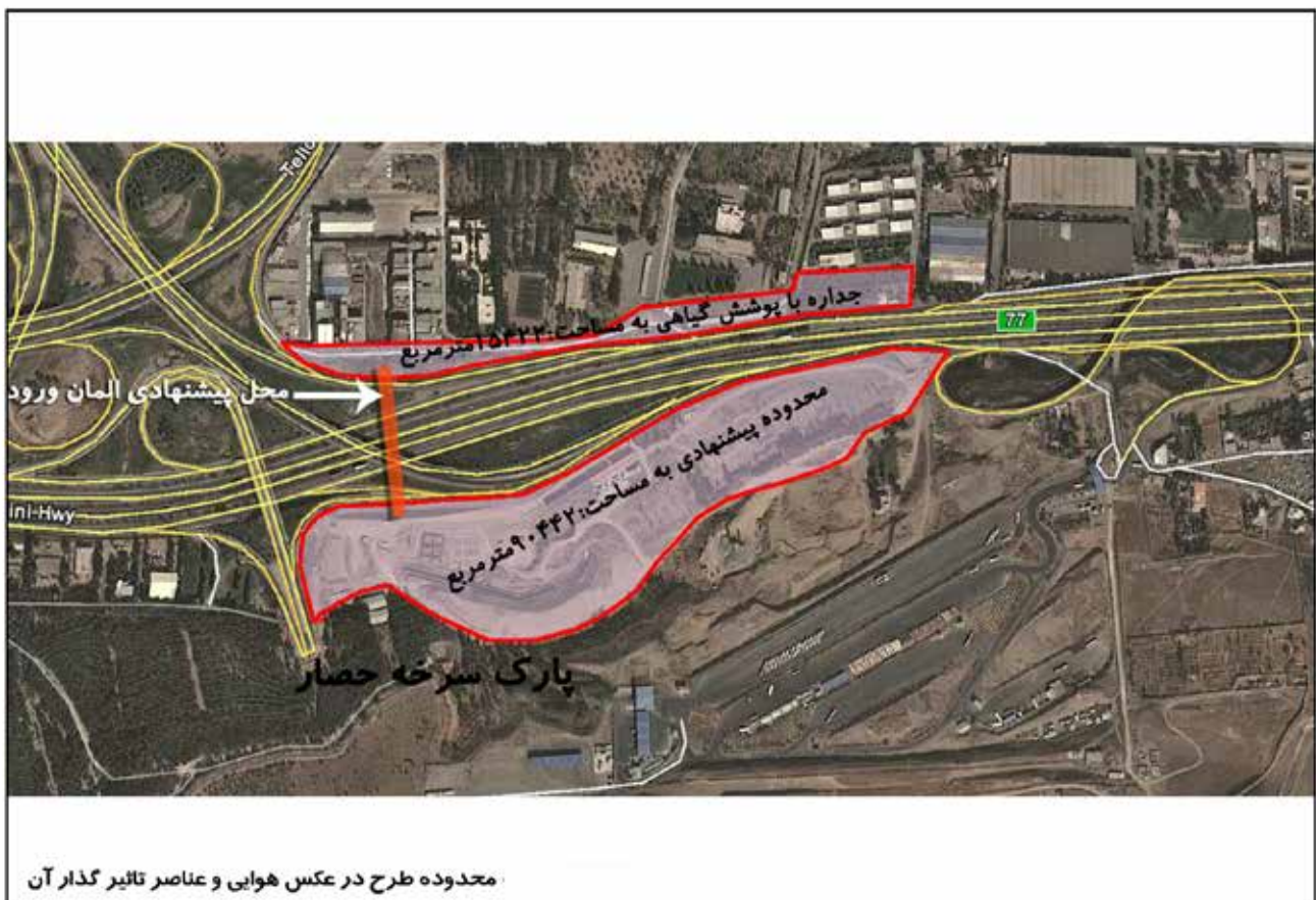
نقشه ۲: محدوده جانمایی طرح در تصویر هوایی.

مساحت ضلع جنوبی فضای در نظر گرفته شده برای استقرار دروازه ۹۰۴۴۲ و مساحت ضلع شمالی ۱۵۴۲۲ مترمربع است. لازم به ذکر است مساحت در نظر گرفته شده جهت ضلع (بال) شمالی محدوده، جهت استقرار پوشش گیاهی نرم، محوطه‌سازی و ساماندهی