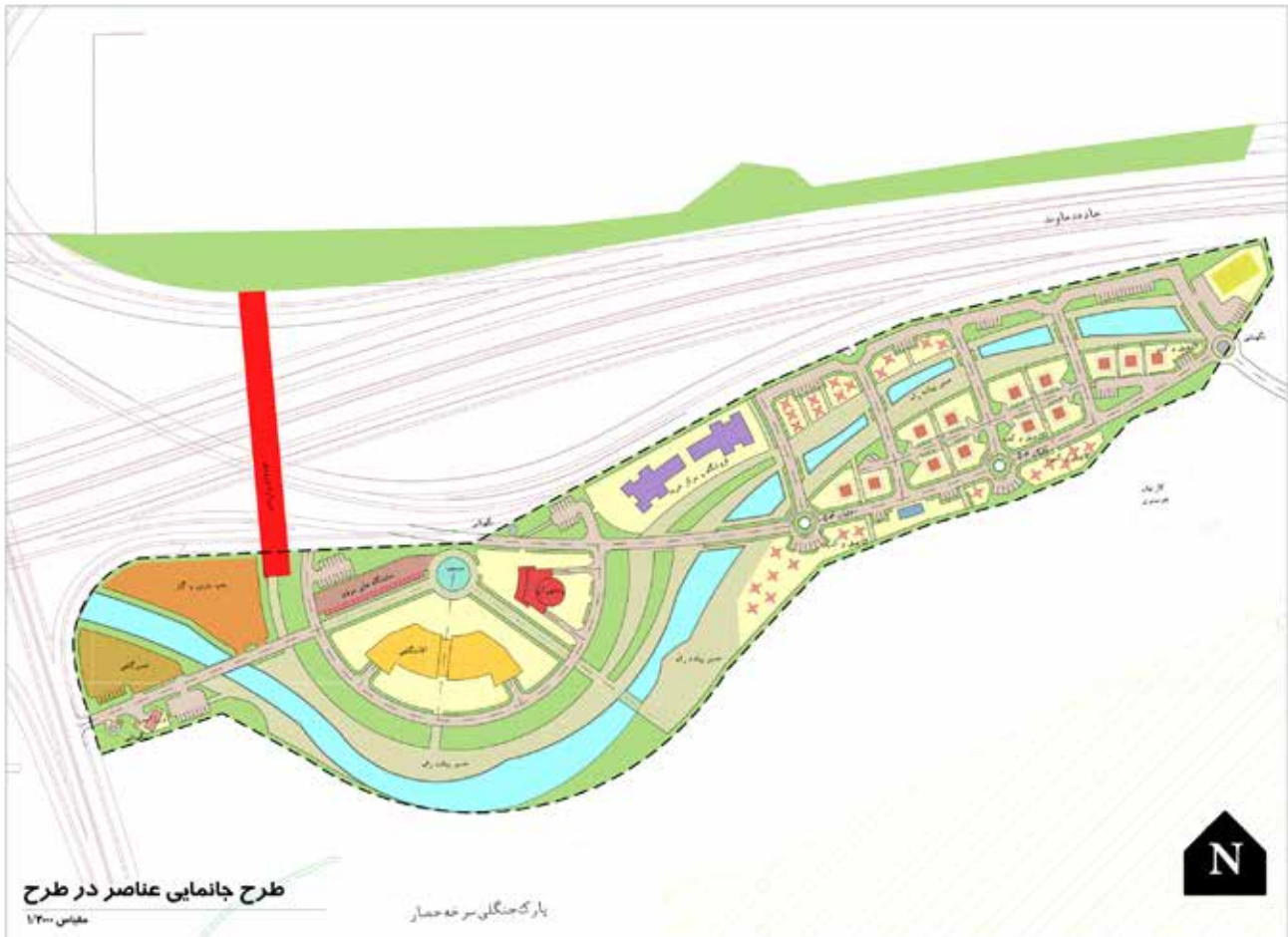
نقشه ۳: طرح جانمایی عناصر در طرح دروازه سرخه حصار.

پارک‌های حاشیه‌ای با هر عنوان و به هر وسیله، در جهت عدم اجازه ورود آنها به شهر و قالب شدن فضاهای شهری بر آنها، یکی از مسائل مهم و به‌روز در کلان‌شهرها و به ویژه «مادرشهر تهران» است. این پژوهش بر اساس مسائل بسیار مهم زیست‌محیطی شهر تهران که یکی از آنها اعتراض بر اقدامات جدید پایانه شرق و احاطه این مجموعه بر شرقی‌ترین قسمت‌های پارک سرخه حصار و همچنین بریده شدن درخت‌های حاشیه‌ای این پارک در لبه جنوبی بزرگراه شهید دوران، تنظیم شده است. شاید روش اتخاذ شده برای این پژوهش، راهکاری در جهت نگهداری از این کلان‌فضای حاشیه‌ای منطقه ۱۳ تهران است. با انجام این پژوهش «واژه‌های جدید» بر مبنای تحقیقات گسترده به وجود آمده است و آن عنوان (پارک- دروازه یا gate-park) است که تاکنون در هیچ منبع علمی یا پژوهشی به آن اشاره نشده است.