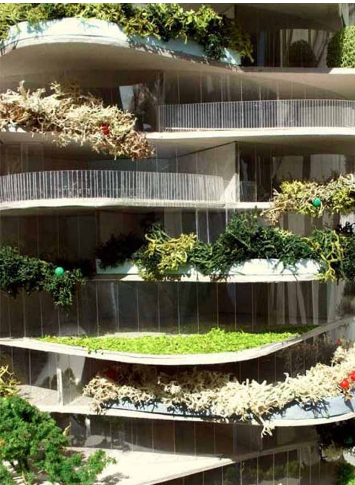
تصویر ۱: برج کاکتوس رتردام هلند بر اساس معماری بیونیک طراحی شده است.