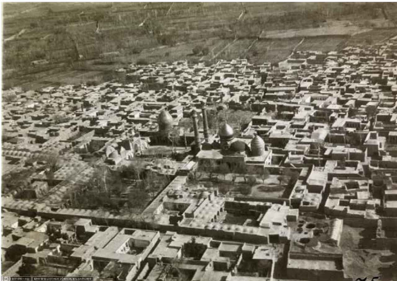
تصویر ۱: آرامگاه شاه عبدالعظیم و باغ‌های اطراف آن.

از یک سو شاهد اقدامات عمرانی و فعالیت‌هایی به منظور مدرن‌سازی کشور در شهرها، مانند تخریب محلات قدیمی و کشیدن خیابان‌های جدید و باغ ملی هستیم و از سوی دیگر، گسترش بروکراسی دولتی به عنوان وسیله‌ای برای تسلط و حاکمیت هرچه بیشتر حکومت مرکزی بر فعالیت‌های روزمره مردم شد (کاتوزیان، ۱۳۸۶).