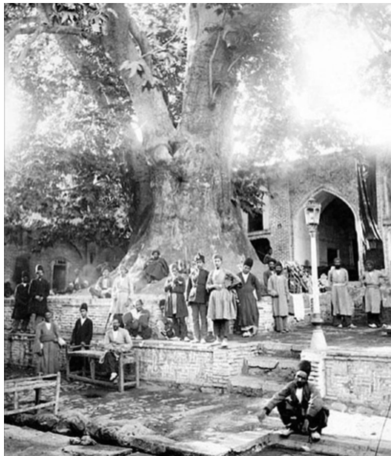
تصویر ۲: درخت چنار کهنسال در جوار امامزاده صالح.

از نمونه‌های اولیه پارک‌سازی معاصر، پارک شهر در محله سنگلج تهران است که در سال ۱۳۳۹ هجری تأسیس شد (تصویر ۵). مساحت این پارک تقریباً ۲۵ هکتار است و هشت ورودی دارد. طراح این پارک دکتر پولن انگلیسی، مشاور شهردار آن زمان بوده است. «پارک شهر بیشتر به قصد ایجاد فضایی شبه‌طبیعی در شهر و مکانی برای گردش و قدم زدن در محیط طبیعی احداث شده بود و