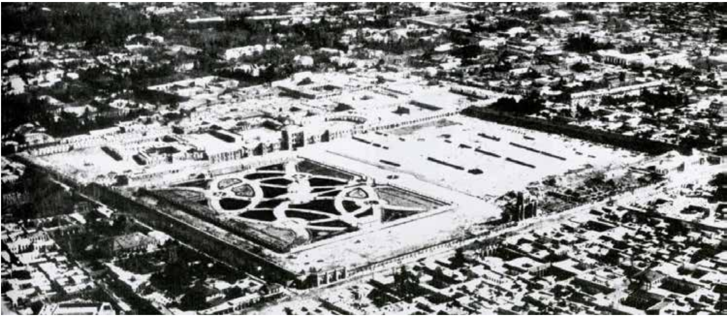
تصویر ۴: عکس هوایی باغ ملی تهران.