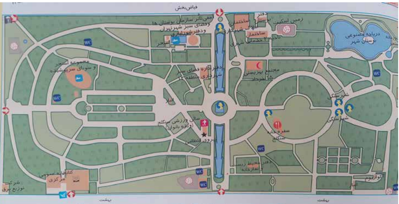
تصویر ۵: پلان پارک شهر.

«باغ ملی دارای بیشترین نزدیکی با شیوه‌های باغ‌سازی غربی اعم از پارک‌های عصر روشنگری و باغ‌سازی باروک پیشرفته است» (همان).