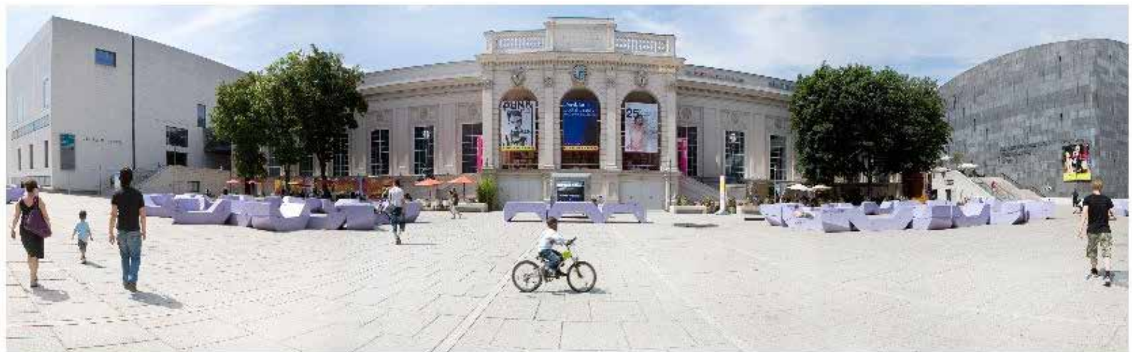
تصویر ۲: تصویر پانوراما از میدان مجموعه موزه‌ها، فضای باز جلوی موزه‌ها به‌عنوان یک عرصه عمومی محلی برای گردهمایی اقشار و گروه‌های مختلف جمعیتی است.