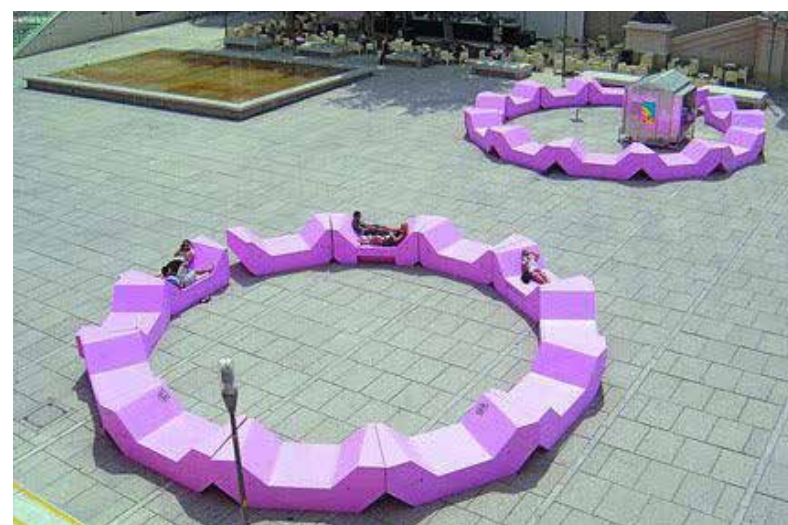
تصویر ۴: مبلمان طراحی شده در مجموعه موزه‌ها: مأخذ: http://www.mqw.at/en