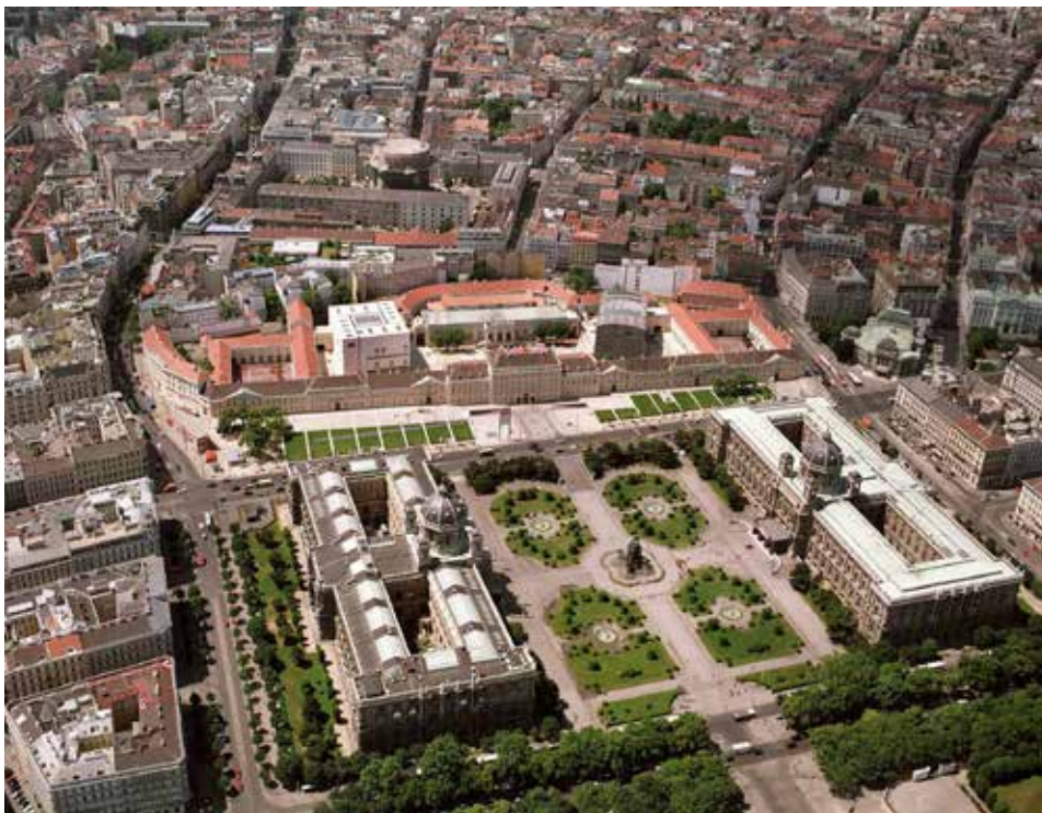
تصویر ۵: جای گیری مجموعه در ارتباط با بافت پیرامون ساختمان‌های موزه در هماهنگی و تعادل با بافت پیرامون قرار گرفته‌اند.

آن قابلیت دسترسی راحت وجود دارد. نفوذپذیری بالای بافت پیرامون به همراه سیستم حمل و نقل عمومی، دسترسی به این فضا را تسهیل کرده که در رونق و سرزندگی آن نقش بسزایی داشته است. تصاویر ۵ و ۶ چگونگی قرارگیری مجموعه و ارتباط آن با بافت پیرامون و مسیرهای ارتباطی را نشان می‌دهد (تصاویر ۵ و ۶).