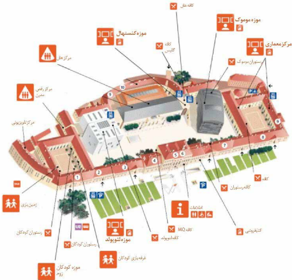
تصویر ۳: جای گیری مکان های مختلف موزه.

میان کاخ سلطنتی و موزه‌ها با محله قدیمی شهر است تا بتوان تمرکز فرهنگی در بافت تاریخی را برای گردشگران احیا کرد.