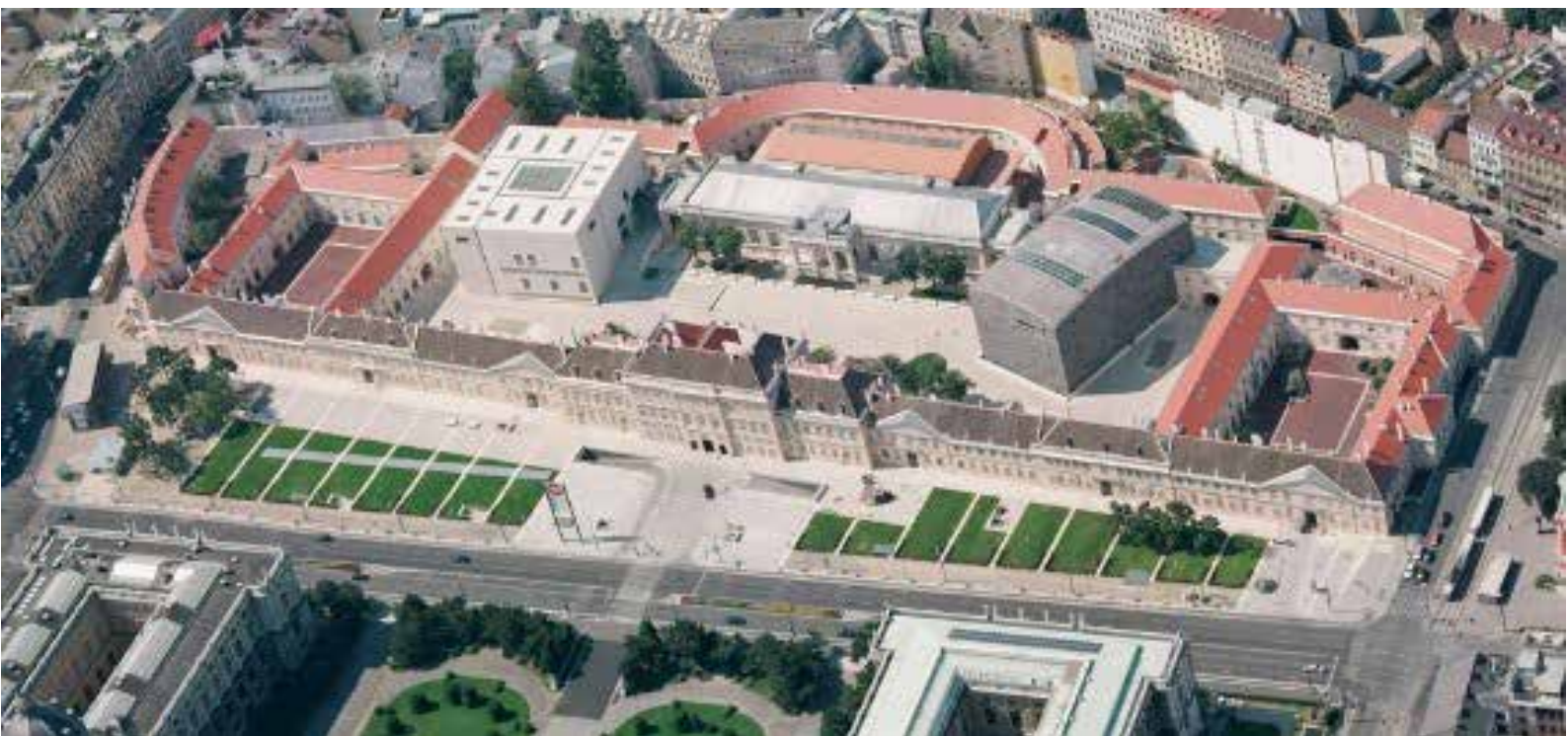
تصویر ۱: تصویر هوایی از مجموعه موزه‌ها- نوع چیدمان بناها در کنار یکدیگر یک عرصه همگانی مطلوب به وجود آورده است.