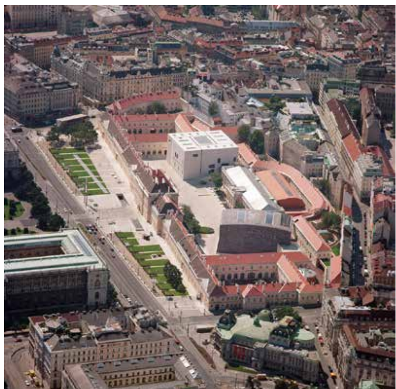
تصویر ۶: چیدمان فضایی ساختمان‌های مجموعه موزه‌ها. یکی از ویژگی‌های این مجموعه نزدیکی مسیرهای ارتباطی با آن است که سبب تسهیل دسترسی و حمل و نقل به این مناطق شده است.

وجود عرصه عمومی وسیع در مقابل موزه آن را به یک پهنه شهری مطلوب در عرصه شهر مبدل ساخته است. مبلمان خاص آن به گونه‌ای طراحی شده که افراد برای امور مختلفی نظیر مطالعه، نشستن، دراز کشیدن، تماشای پیرامون و برقراری ارتباط با سایرین از آن استفاده می‌کنند. این مسئله سبب تقویت غنای این عرصه عمومی شده تا بتواند به شخصیت بصری مطلوب خود دست یابد و بتواند هم‌نشین مناسبی برای این بناهای فاخر و مجلل باشد. یکی از عوامل پایداری در رونق پاتوق‌های فرهنگی تولید و مصرف فرهنگی است. وجود استودیوهای کوچک مختص هنرمندان سبب تولید آثار هنری در این مکان‌ها شده است. کالای تولیدشده از طریق فروشگاه‌های عرضه محصولات فرهنگی به فروش می‌رسد و بدین ترتیب چرخه حیات اقتصادی پروژه ادامه پیدا می‌کند.