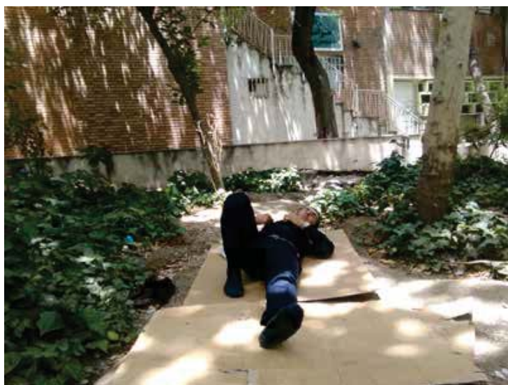
تصویر ۱: محوطه بیمارستان که به عنوان محل اسکان همراهان بیماران مورد استفاده قرار گرفته است. عکس: مریم زاهدی، ۱۳۹۵.