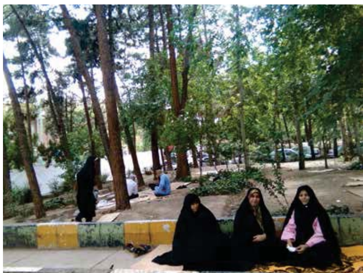
تصویر ۲: محوطه بیمارستان به عنوان محل تجمع ملاقات‌کنندگان مورد استفاده قرار می‌گیرد. عکس: مریم زاهدی، ۱۳۹۵.

دستیابی به نتایج فوق مفهوم سکونت در بیمارستان امام را هویدا کرد؛ از بیمارانی که تا ماه‌ها بر تخت بیمارستان‌ها بستری هستند تا همراهان بیماران و حتی پزشکان که تا سه روز هم در صورت نیاز در محیط بیمارستان سکونت دارند (جدول ۵). انسان بیشتر عمر خود را در فضاهای مکان‌مند به سر می‌برد؛ خانه، محل کار، محل عبادت، این فضاها محل سکونت‌اند یعنی باید آدمی را از گزند هر آنچه سلامت جسم و جانس را تهدید می‌کند، در امان دارند. سکونت‌گزیدن مستلزم ساختن نیز است که علاوه بر معنای ظاهری آن، که بنا کردن است، معنی تربیت،