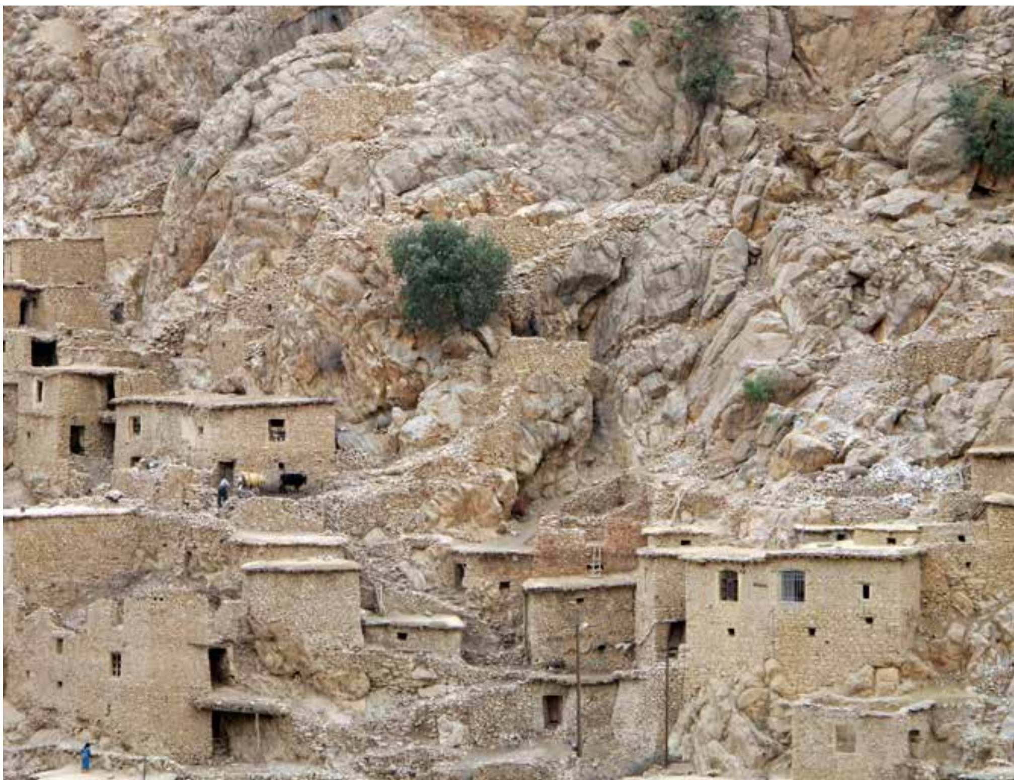
تصویر ۱: روستای پالنگان. عکس: سید امیر منصوری، ۱۳۹۴.

مجله منظر بازنویسی شده است. در بخش نخست نگاهی به رابطه کوردها با طبیعت و جایگاه کوهستان در فرهنگ کورد می‌اندازیم. بخش دوم شامل مجموعه‌ای تصویر-نوشت از روستاهای پالنگان و آویهنگ می‌شود که در پی یافتن بازنمودهای معمارانه هم‌نشینی میان انسان و طبیعت است و به تحلیل ضمنی چگونگی و چرایی این هم‌نشینی و بی‌مرزی می‌پردازد. این تصویر-نوشت‌ها بر اساس برداشت‌های شخصی معمار طی بازدید از این دو روستا شکل گرفته‌اند. دیاگرام و تصویر در کنار نوشته، به‌عنوان ابزار تفکر به‌کاررفته‌اند؛ و با کمک توصیف، تخیل، بال‌وپر دادن و اغراق آگاهانه در وضعیت کنونی، سعی در نمایان کردن ایده‌های فضایی نهان در پس هر یک از موقعیت‌های انتخاب‌شده دارد. رویکرد این پژوهش به روستاهای تاریخی، فراتر از رویکرد حفاظت و نوسازی متداول به این میراث فرهنگی بوده و بر مبنای نگاهی پویا و