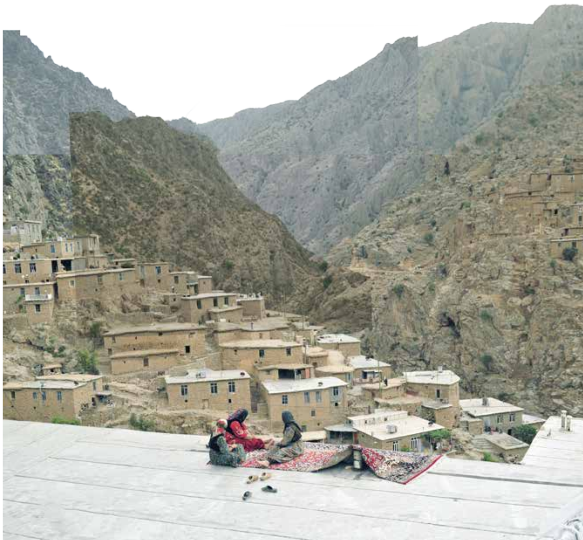
تصویر ۲: روستای پالنگان. عکس: سید محمدباقر منصوری، ۱۳۹۴.

می‌کند، هر یک بخش سازنده‌ای از تمامیت طبیعتی است که هر فرد کورد همواره می‌کوشد تا چون آینه‌ای آن را بازتاب دهد.» (Izadi, 1992).