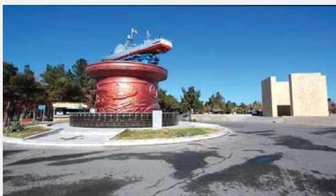
یادبود شهدای نیروی دریایی بدون تماشاچی