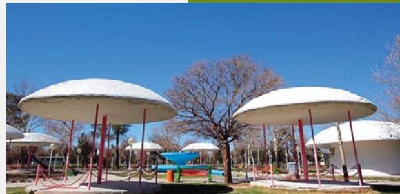
خالی ماندن فضاهای پر هزینه در خارج شهر