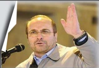
در حاشیه نخستین همایش سالانه نوسازی بافت‌های فرسوده شهری دکتر محمدباقر قالیباف: