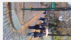
یکی از معابر درون گورستان