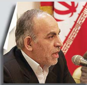
در پنجمین نشست شهرداران مناطق کلان‌شهرهای کشور

اقدامات انجام شده برای نوسازی بافت‌های فرسوده، از سوی اغلب مردم و دست‌اندرکاران ناکافی ارزیابی می‌شود. آیا پیچیدگی مسئله مانع شناخت راه حل است یا مدیریت نوسازی در ابهام قرار دارد؟ گزیده‌ای از مباحث نوسازی تا حدی روشن‌تر است.