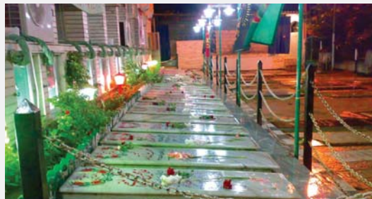
تداوم سنت آراستن قبور نزد مردم