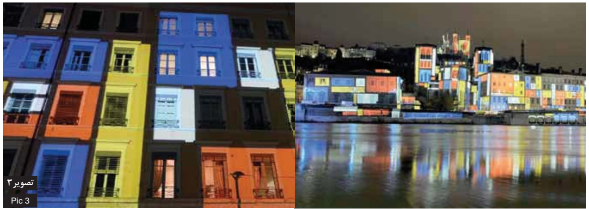
تصویر ۳ Pic 3

Pic 3: Illumination of the buildings inspired from painting tableau along the waterfront -quays of the Saône river-, 2010, Lyon, France.