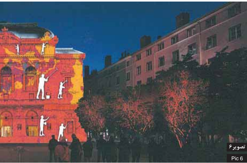
تصویر ۶ Pic 6

تصویر ۶: میدان سلسنتن، نمایش ترکیبی تصویر و معماری با استفاده از تکنیک‌های مجازی، لیون، فرانسه. Pic 6: Place des Celestins, Archipictorial animation by virtual technics, Lyon, France.