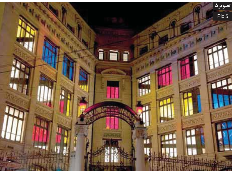
تصویر ۵ Pic 5

تصویر ۵: پروژه آماتوری، دبیرستان لامانتینریا الهام از آثار موندریان، جشن نور لیون ۲۰۱۰، فرانسه. Pic 5: School of La Martinière, one of the students experiments inspired from Piet Mondrian abstract painting, Festival of lights 2010, Lyon, France.