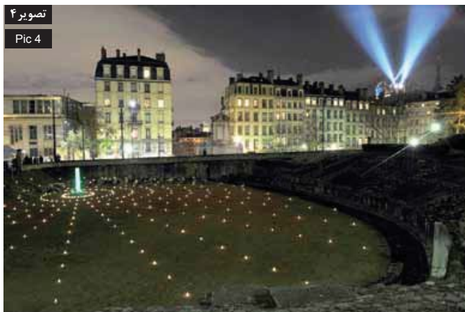
تصویر ۴ Pic 4

Pic 4: Amphitheatre of the Three Gauls - memorial to the martyrs- has illuminated by a different and calm atmosphere and created in constellation shapes, 2010, Lyon, France.